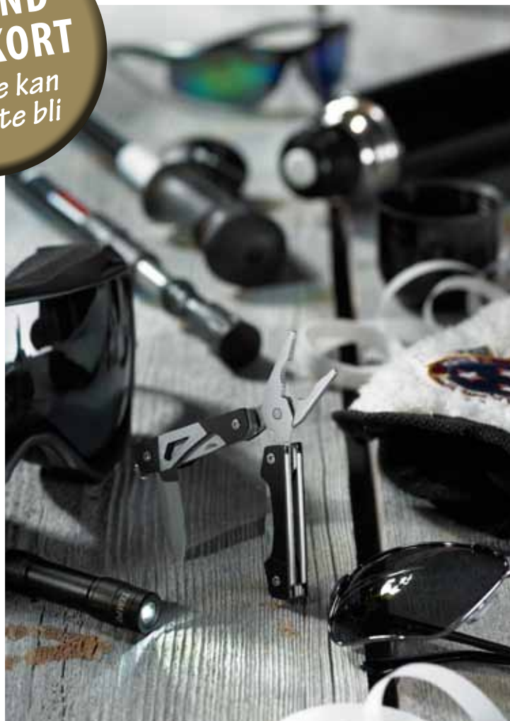
Produkter för hälsa, friskvård, fritid eller hobby. T ex Polaroid solglasögon/skidglasögon, skidtilbehör, rygg-säckar, termosar mm.