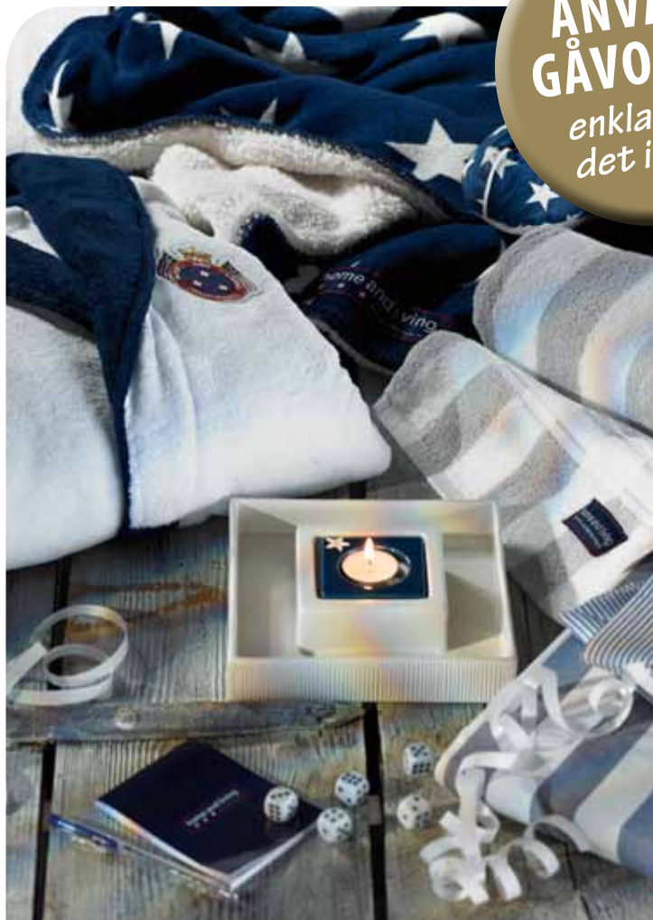
Produkter med hög trivselfaktor för hemmet från Home and living. T ex. plädar, frotté, bäddset, morgonrockar mm.